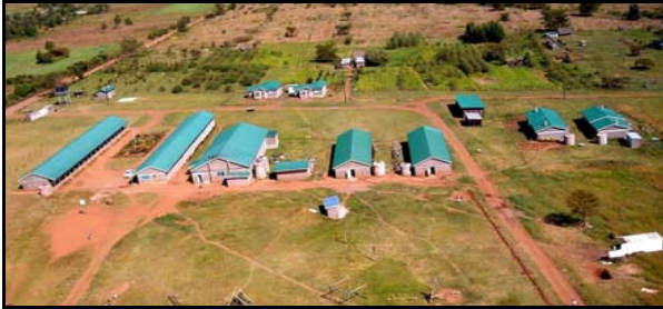
Die achtklassige Rehema-Grundschule in Nakuru