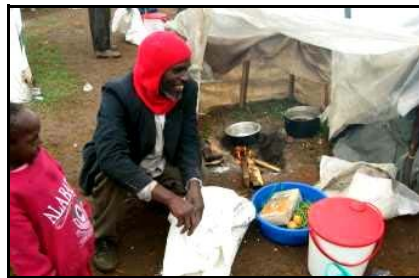
Eine Mutter mit Kind vor ihrem Zelt in Eldoret beim Kochen

Seit 22. Januar 2008 ist MCF voll beteiligt an einem internen Flüchtlingslager. Das Lager ist eine große Herausforderung, nicht nur für MCF, sondern auch für die Regierung und andere Hilfsorganisationen. Eine große Zahl von Menschen lebt unter einer riesigen dunklen Wolke. Sie wissen nicht, was jeder neue Tag bringt. Sie wissen nicht, was sie essen und wo sie leben sollen. Sie sind ohne Hoffnung und sie haben keine Perspektive für die Zukunft.