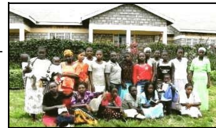
Erste Gruppe von Müttern in MCF Yatta

Für ihre Kinder, die teilweise im Flüchtlingslager geboren sind, ist die Zusammenführung mit den Müttern wichtige Voraussetzung für eine normale Entwicklung.